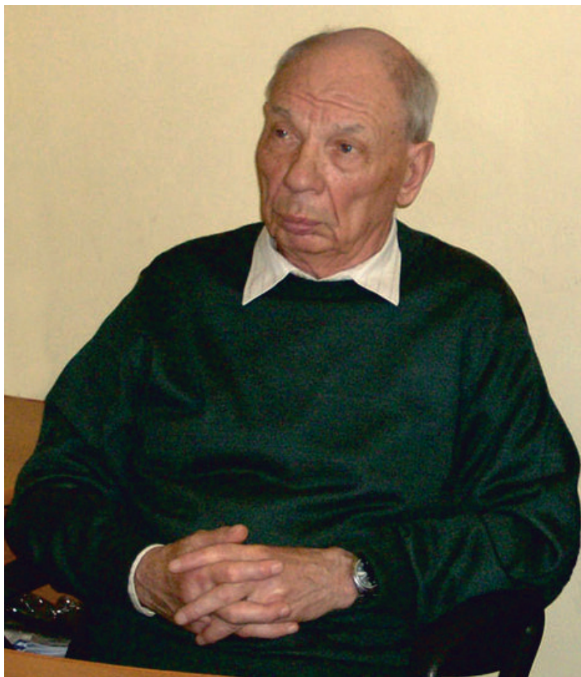
ЕЛЬМЕЕВ Василий Яковлевич (1928 – 2010)